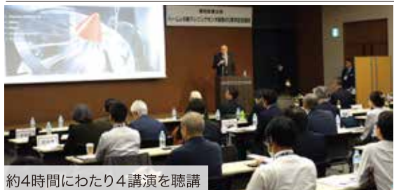
約4時間にわたり4講演を聴講

「愛知産業は何度もハームレにインスピレーションを与えてきた信頼、日本マーケット開拓の協力関係を象徴」 (ハームレ社 ミハエル・ビッサー営業本部長)